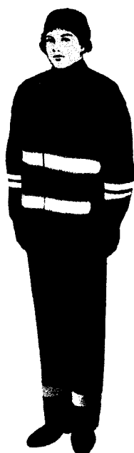
Женский зимний комплект