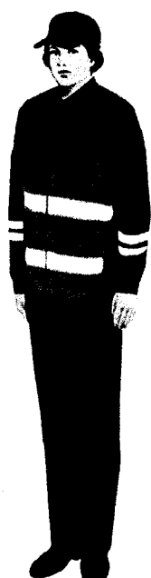
Женский летний комплект