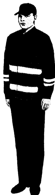
Летний мужской комплект