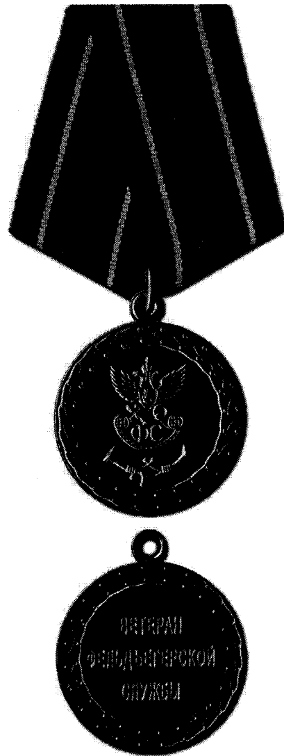
РИСУНОК ведомственного знака отличия Государственной фельдъегерской службы Российской Федерации – медали «Ветеран фельдъегерской службы»

к приказу ГФС России от « 08 » июля 2016 г. № 204