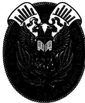
РИСУНОК нагрудного знака «За вклад в развитие государственной статистики»