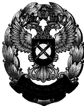
РИСУНОК нагрудного знака «Почетный работник антимонопольных органов России»

Нагрудный знак имеет миниатюрную копию. Размеры миниатюрной копии нагрудного знака: высота – 15 мм, ширина – 12 мм.