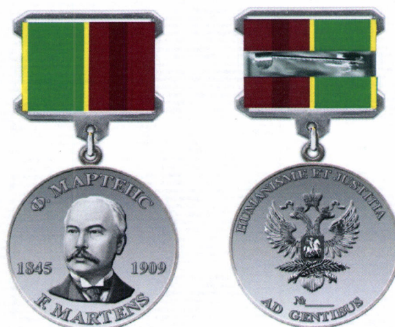
Рисунок нагрудной медали Ф.Ф.Мартенса Министерства иностранных дел Российской Федерации