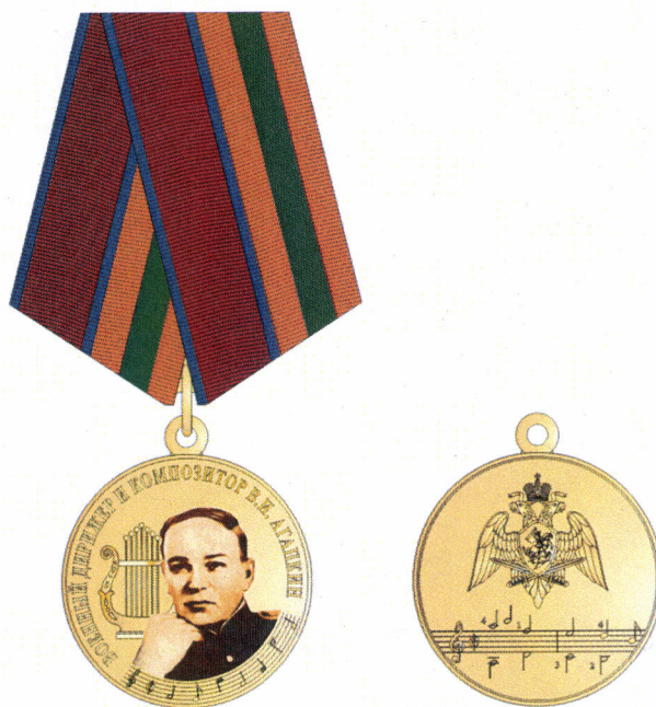
лицевая сторона оборотная сторона

официального геральдического знака – памятной медали Федеральной службы войск национальной гвардии Российской Федерации «Военный дирижер и композитор В.И. Агапкин»