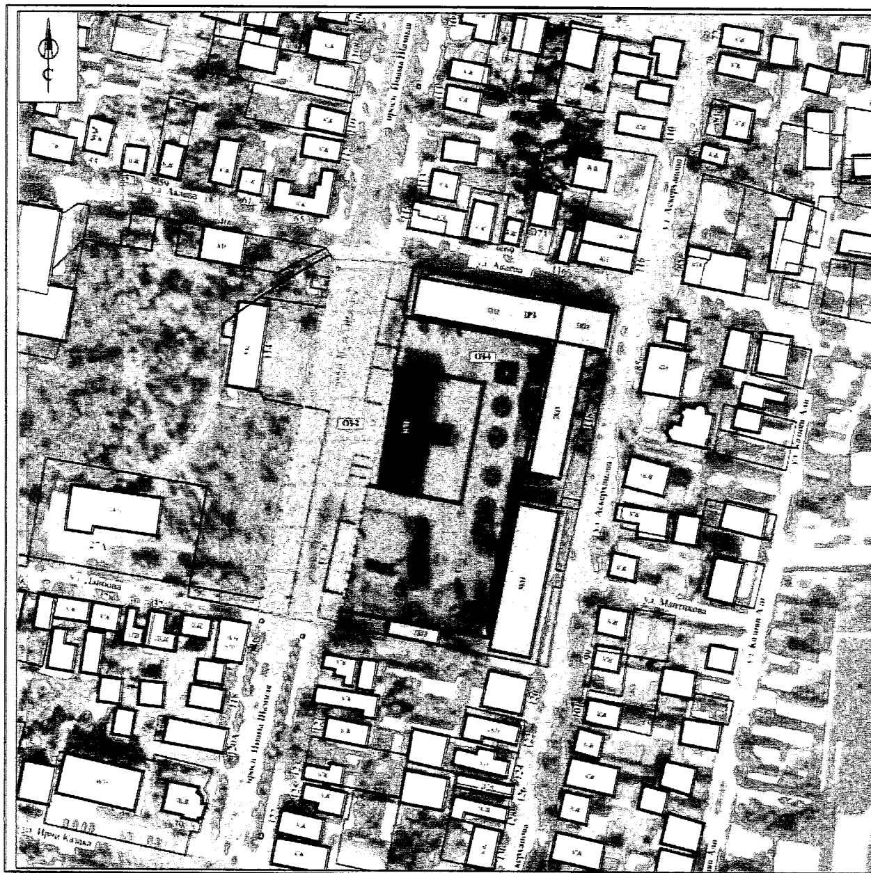
Рис.2. Карта (схема) границ зон охраны объекта культурного наследия регионального значения «Здание педучилища им. Батырмурзаева», 1910 г. (Республика Дагестан, г. Хасавюрт, пр. Имама Шамиля, 117).