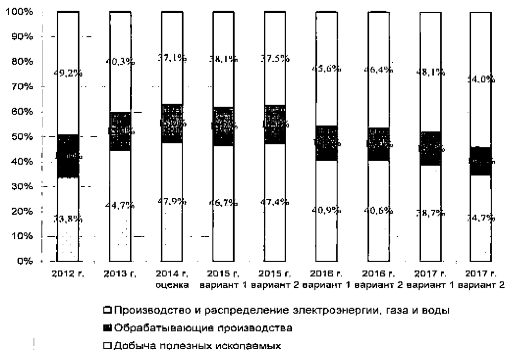
Рис. 1. Структура промышленного производства в 2012-2017 годах

В структуре промышленного производства в 2013 году преобладает добыча полезных ископаемых – 44,7%, производство и распределение электроэнергии, газа и воды составило 40,3%, обрабатывающие производства – 15,0%.