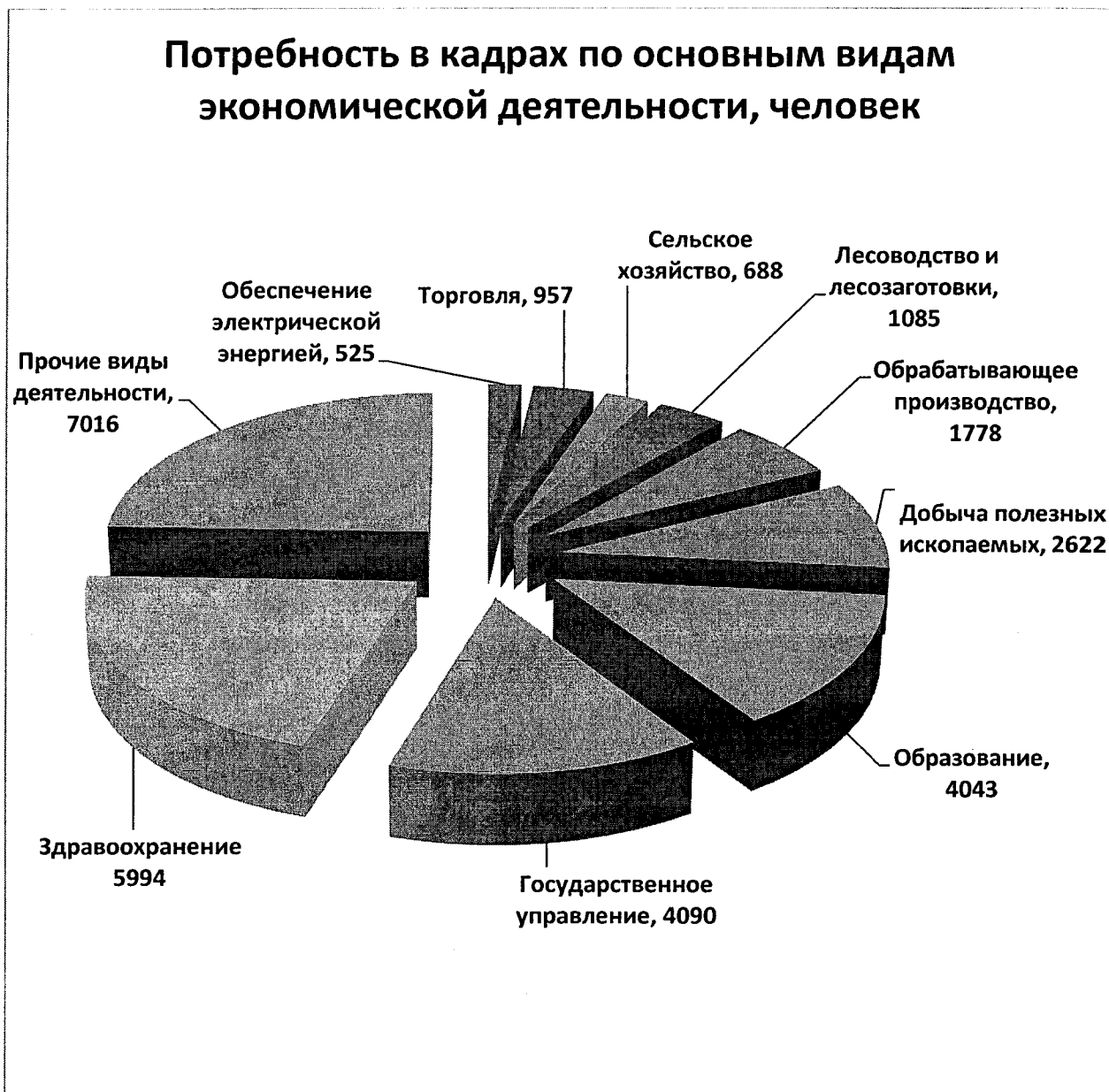
Рисунок 1. Потребность в кадрах по основным видам деятельности