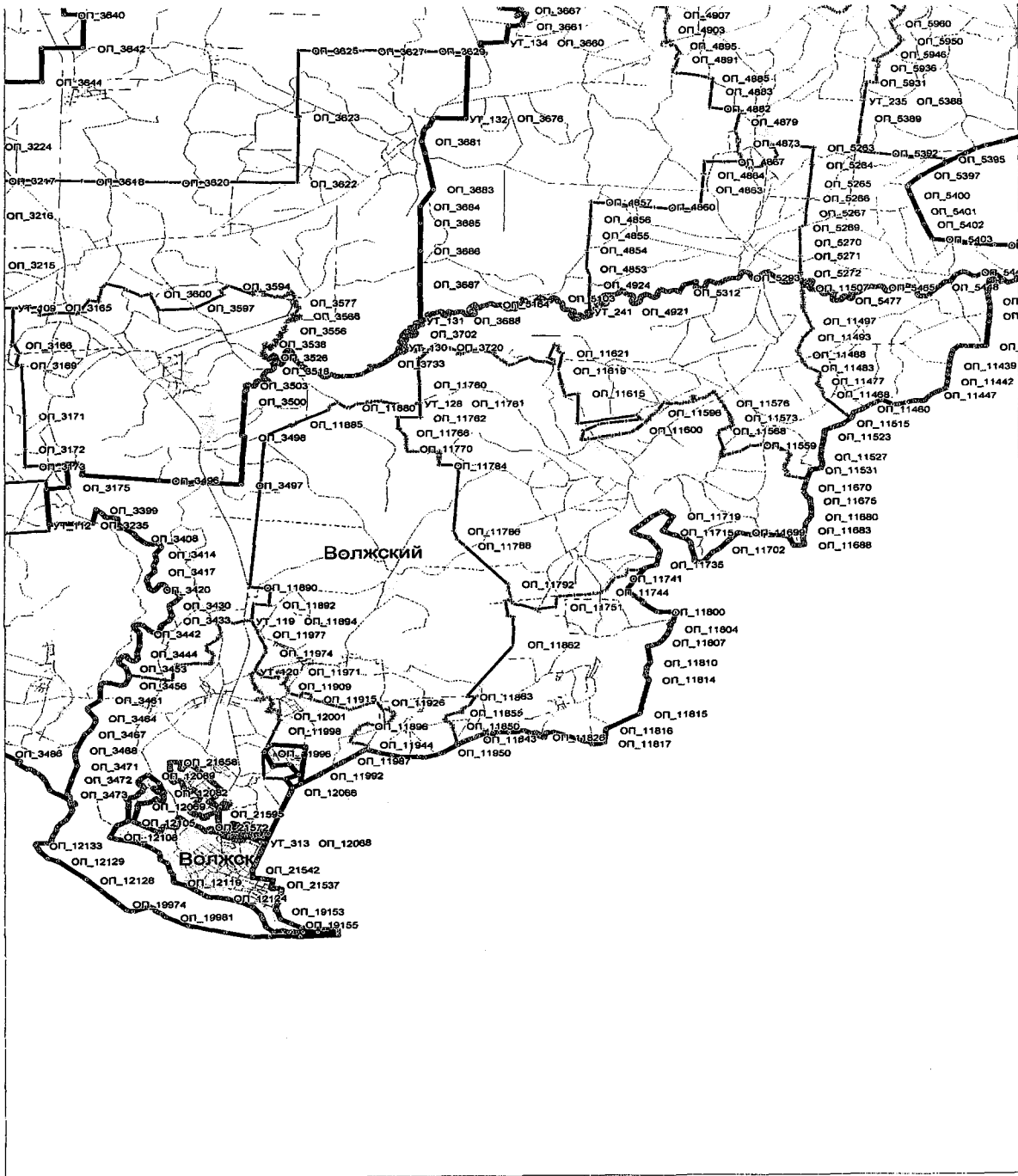
Схема границ Волжского муниципального района