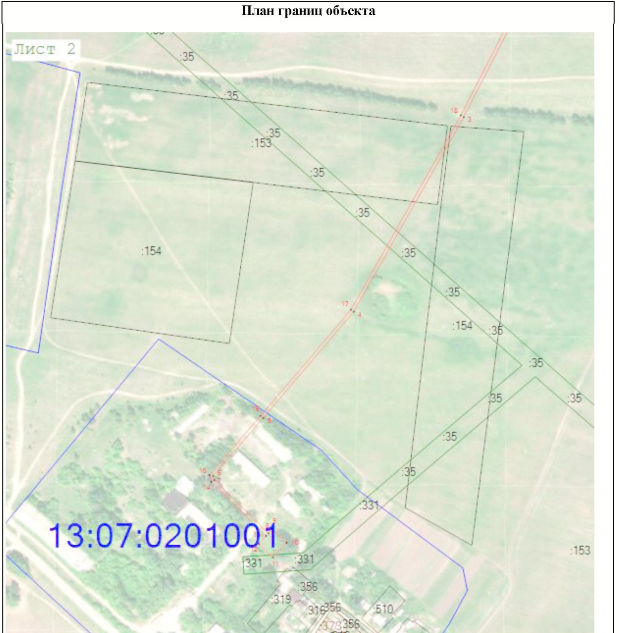
Масштаб 1:4 000

Используемые условные знаки и обозначения: