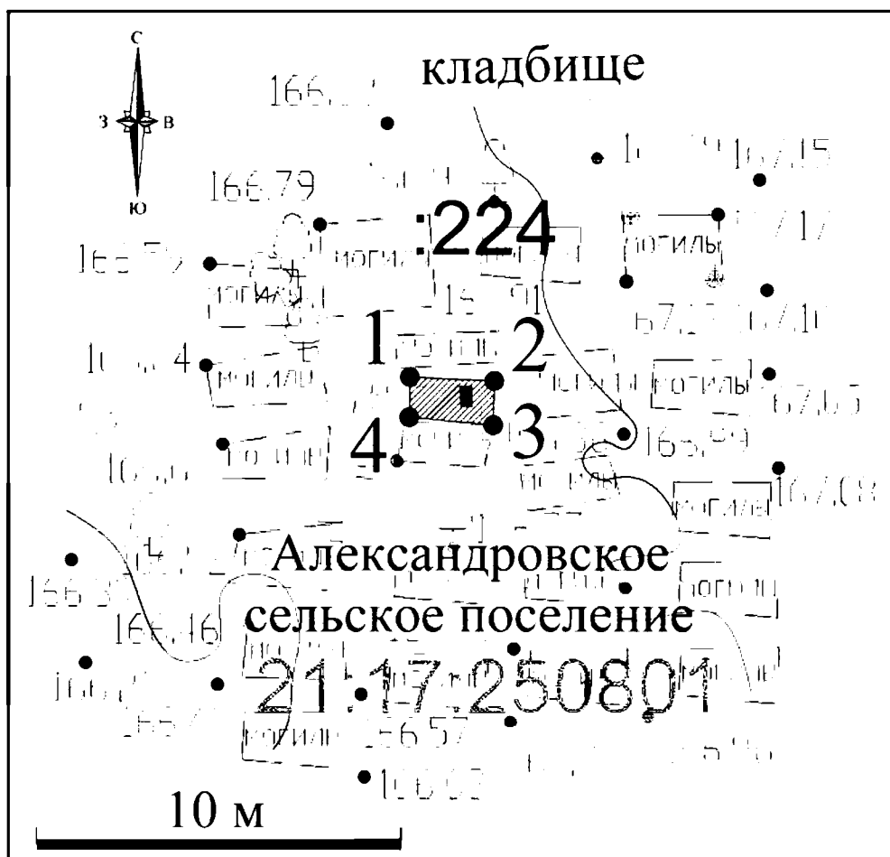
Схема границ территории объекта культурного наследия (памятника истории и культуры) регионального (республиканского) значения «Могила комсомольца Андрея Анисимова, убитого кулаками в 1934 году. На могиле установлен обелиск», расположенного по адресу: Чувашская Республика, Моргаушский муниципальный округ, с. Александровское, кладбище с. Александровское (далее - объект культурного наследия):