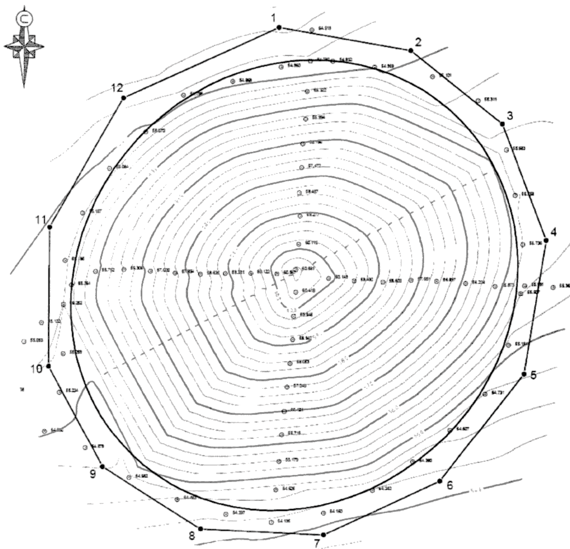
Карта (схема) границ территории объекта культурного наследия