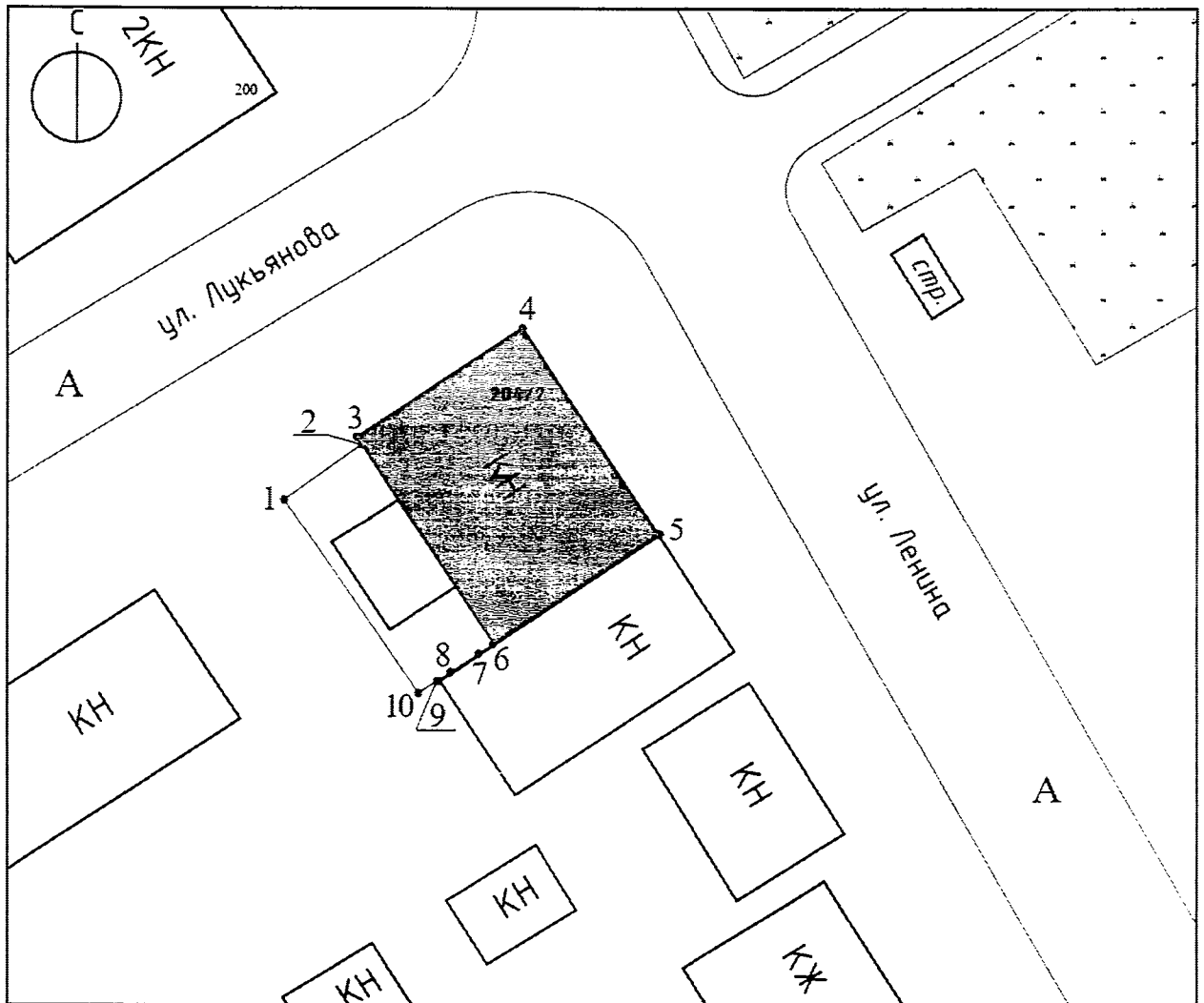
Карта (схема) границ территории объекта культурного наследия