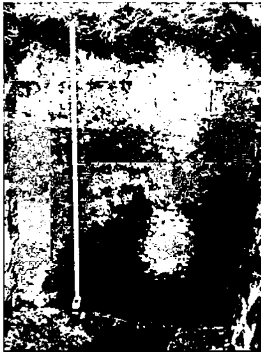
Рис. 1. Почвенный профиль дерново-подзолистой почвы (57.020553, 40.955668)