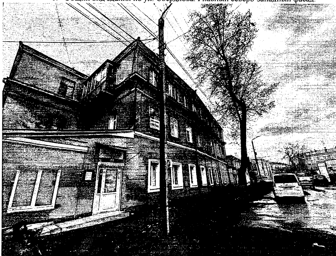
2. Вид на здание с северного направления.