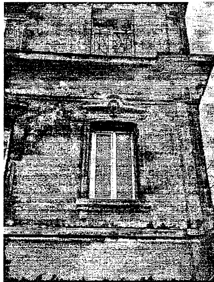
4. Фрагмент главного фасада