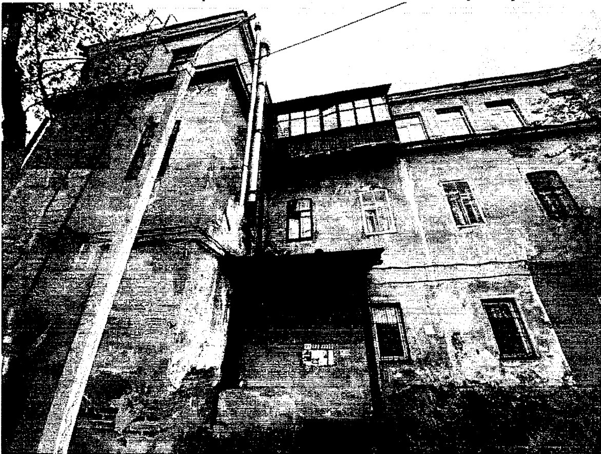
11. Фрагмент дворового фасада.