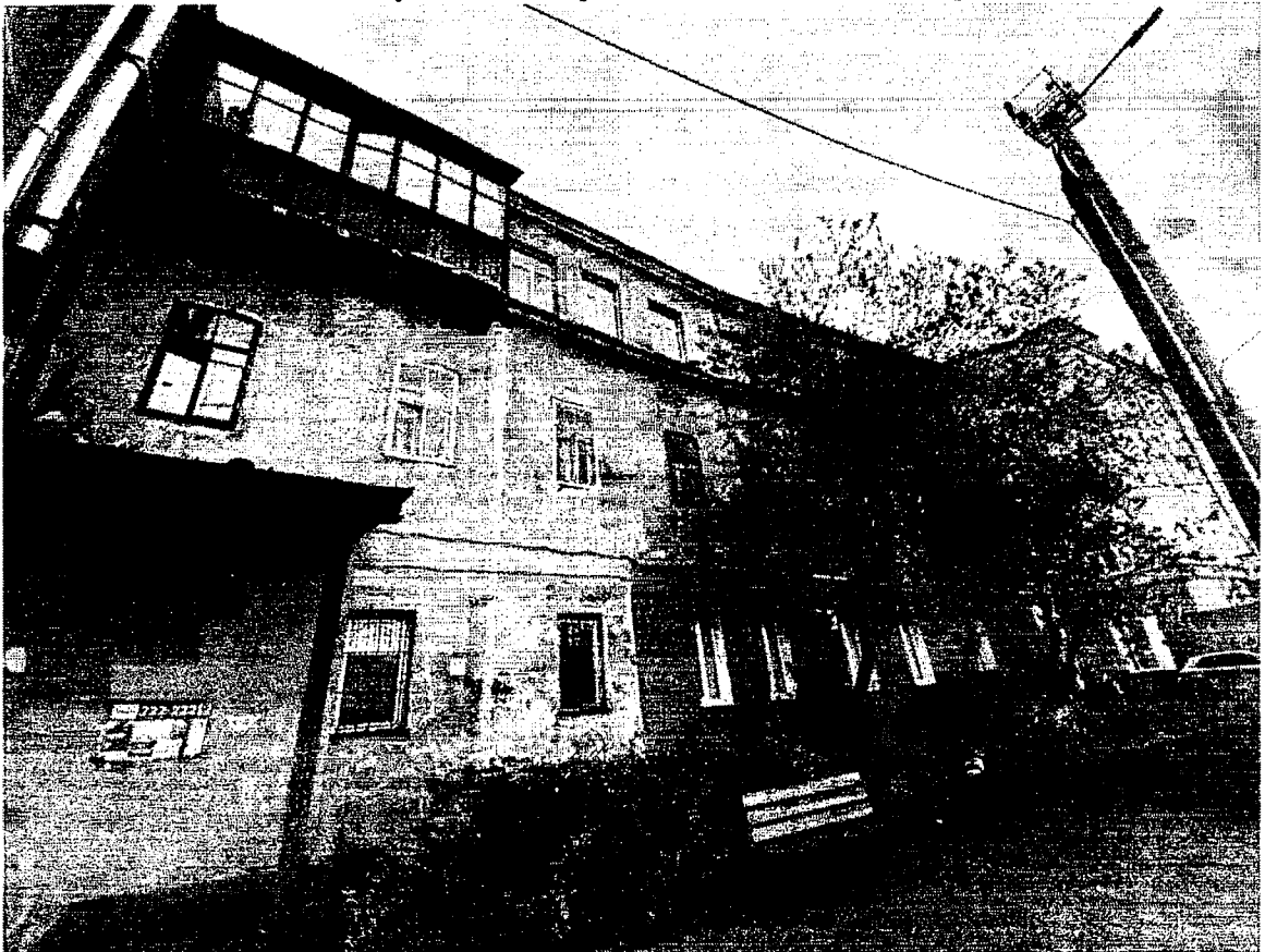
9. Дворовой юго-восточный фасад дома.