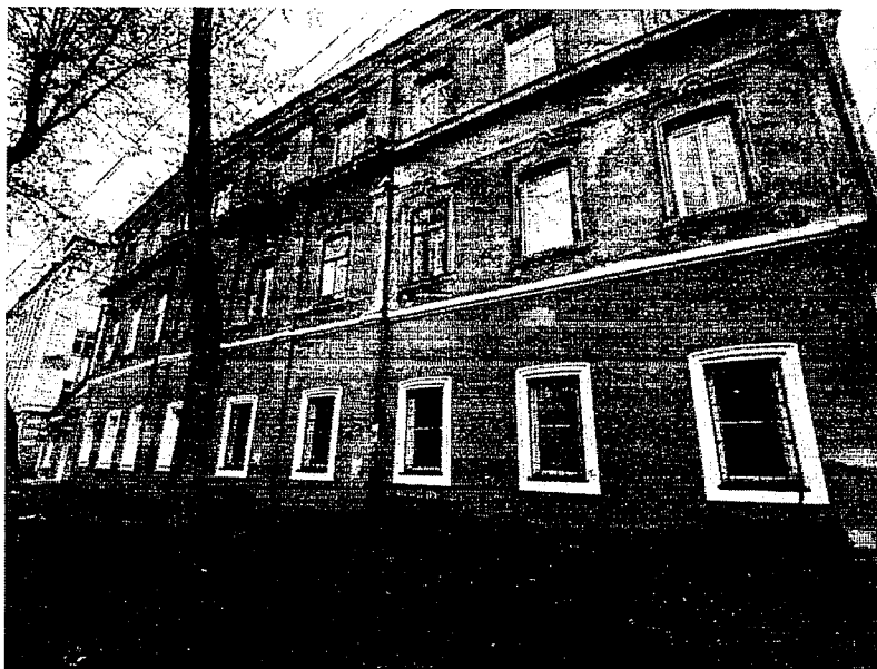
1. Общий вид здания по ул. Свердлова. Главный северо-западный фасад.