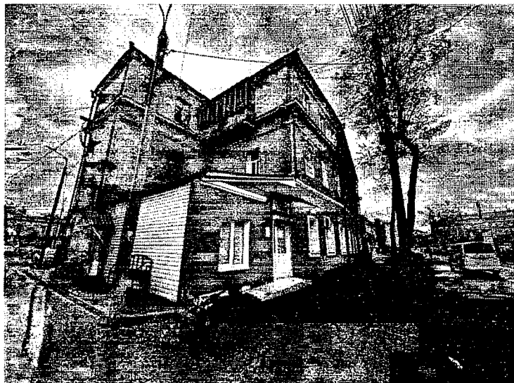
5. Северный угол дома