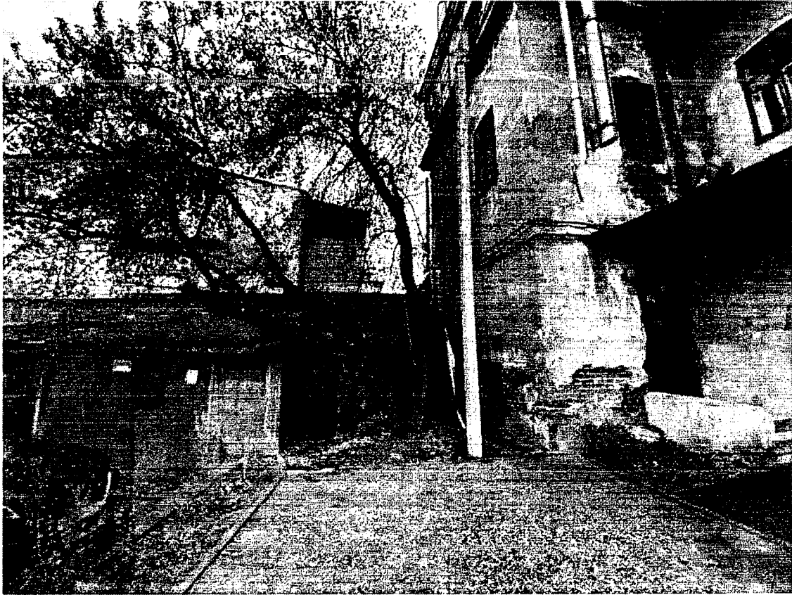
10. Место сопряжения исследуемого дома с соседним зданием по у. Свердлова. Вид со двора.