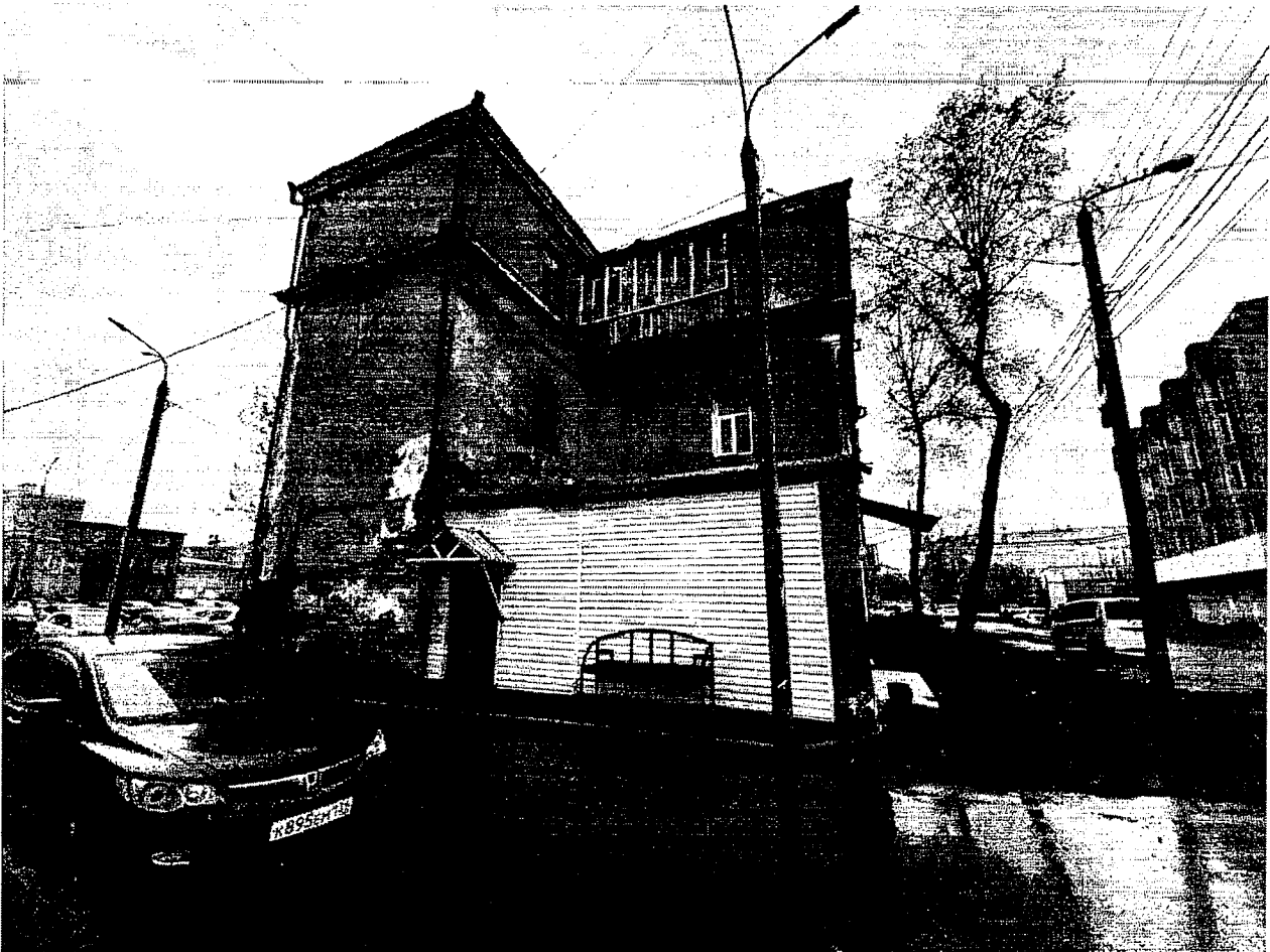
6. Боковой северо-восточный фасад дома.