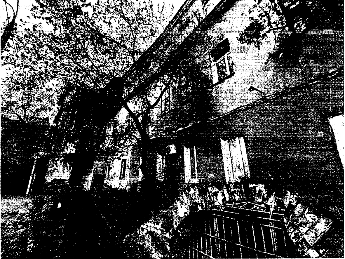
8. Фрагмент дворового юго-восточного фасада.