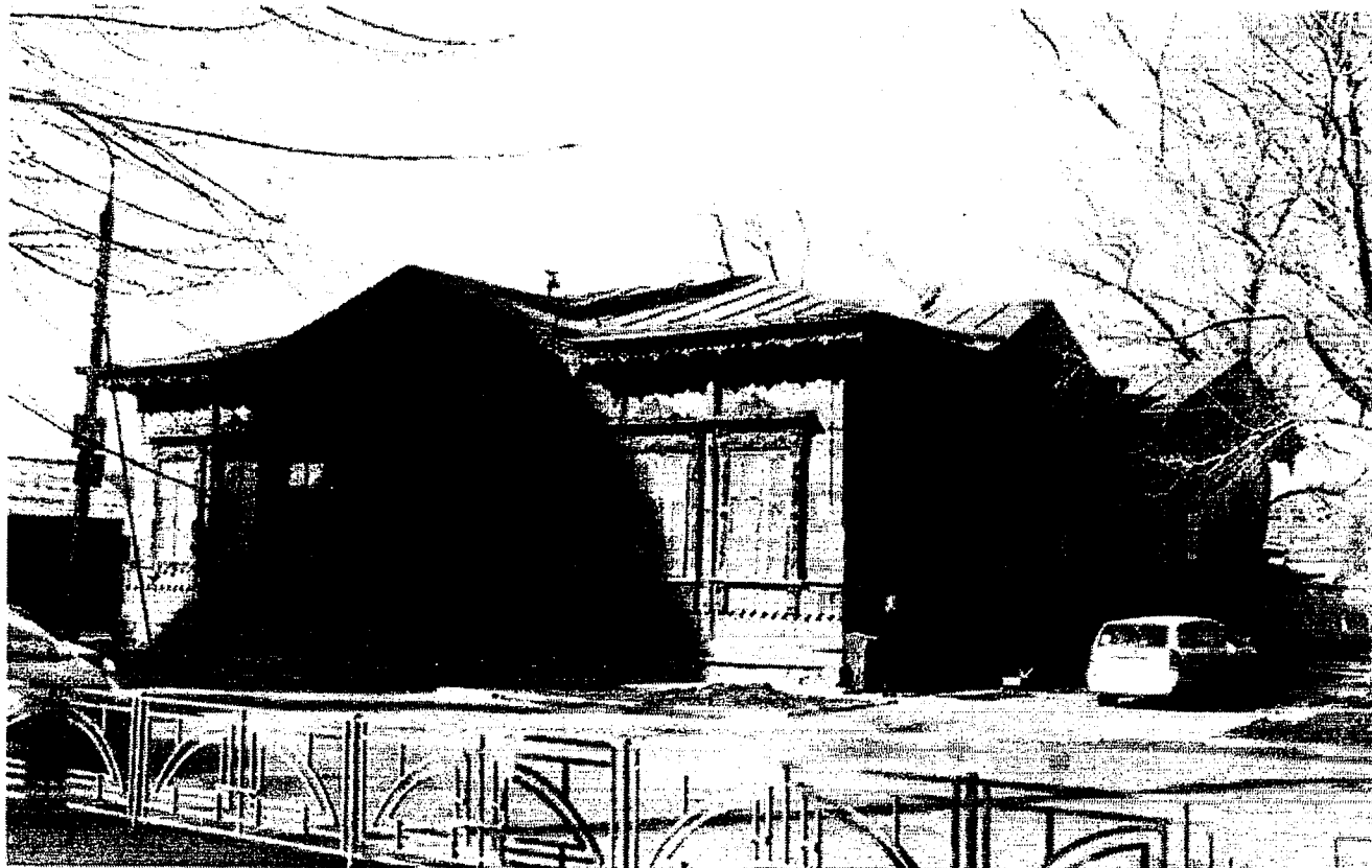
Общий вид здания со стороны ул. Баррикад