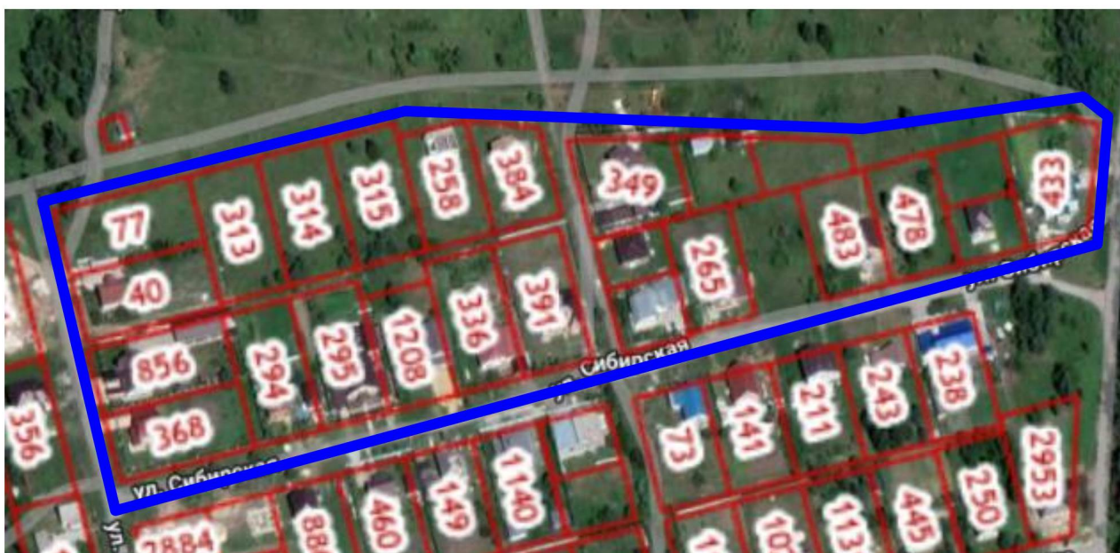
Схема границ территории для подготовки проекта межевания территории в районе улиц И. Мазурука и Сибирская в городе Липецке (Сселки, квартал № 188)