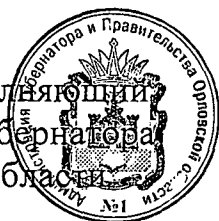
В. А. Тарасов

Временно исполняющий обязанности Губернатора Орловской области