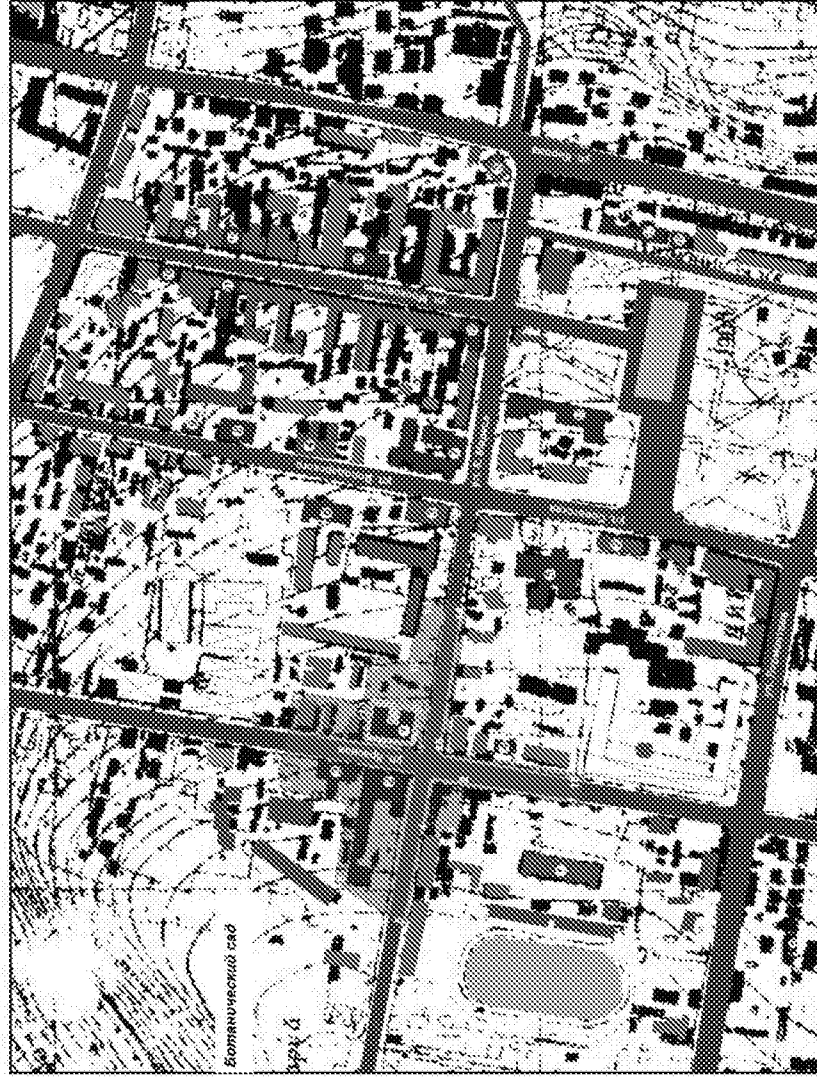
Схема границ охранной зоны