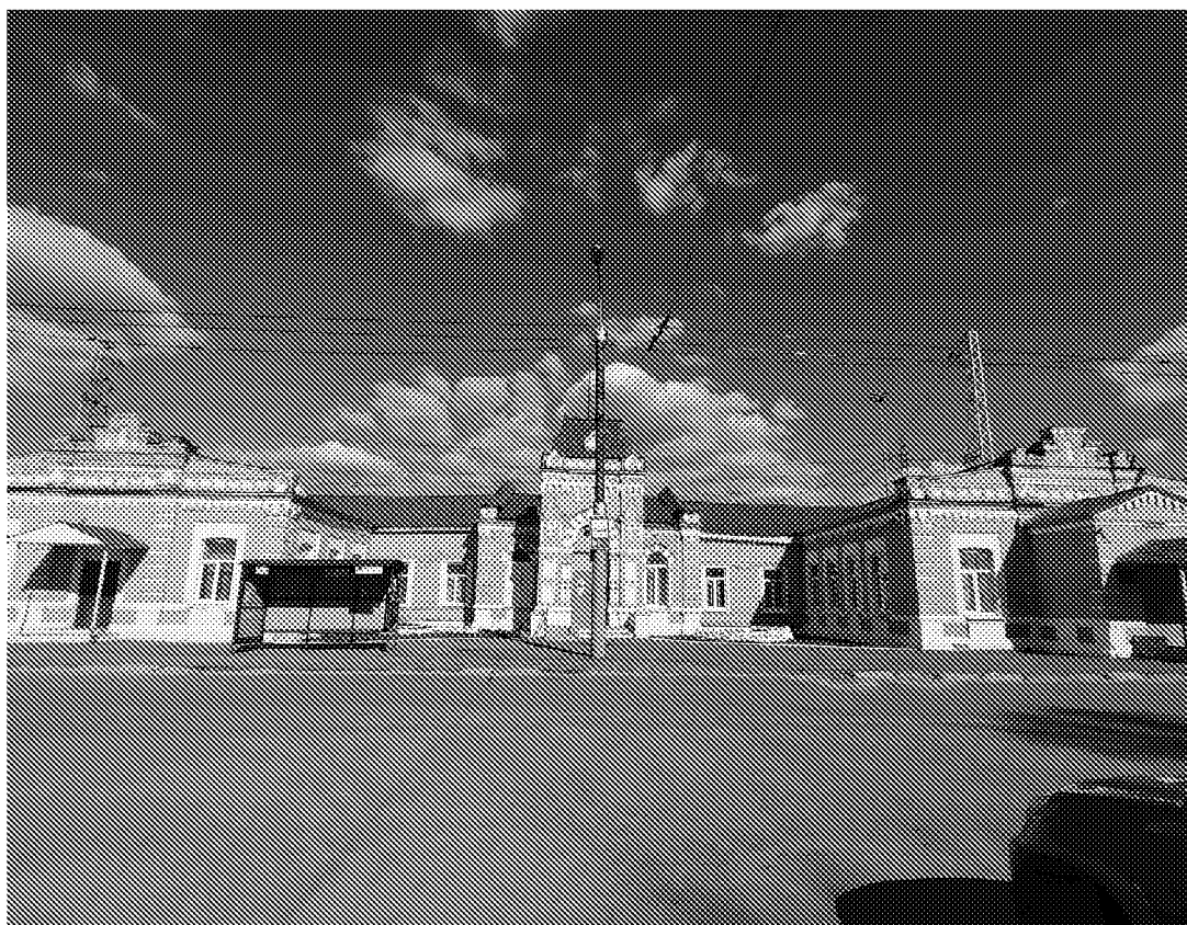
Центральный (западный) фасад объекта культурного наследия