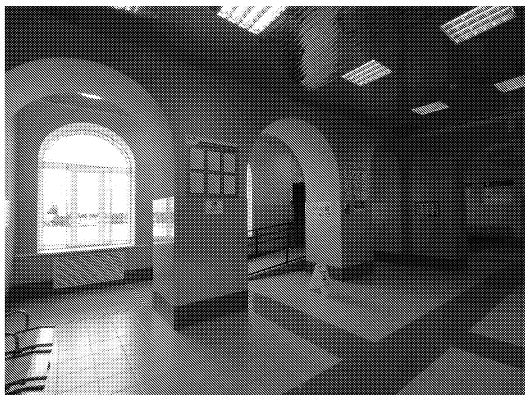
Интерьеры зала ожидания станции Пенза-3