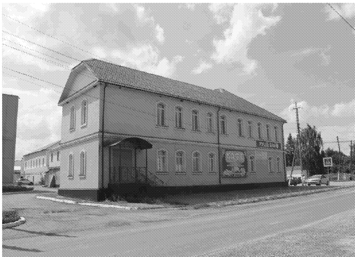
Северный фасад объекта культурного наследия