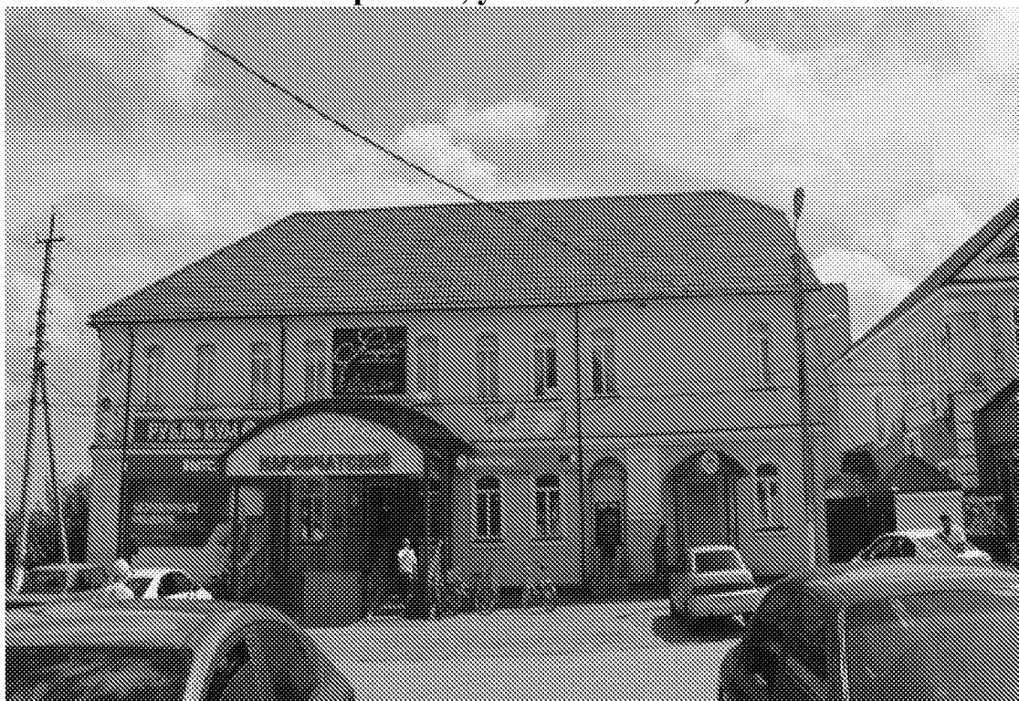
Западный фасад объекта культурного наследия

Фотографическое изображение объекта культурного наследия «Здание (ныне – вспомогательная школа), где 14 (27) декабря 1917 года провозглашено установление Советской власти в Наровчате и Наровчатском уезде» (Пензенская область, Наровчатский район, с. Наровчат, ул. Советская, 22)