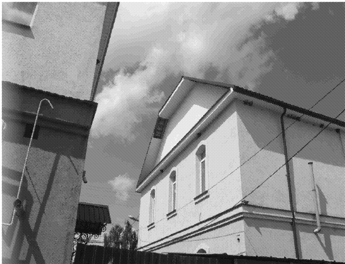
Южный фасад объекта культурного наследия