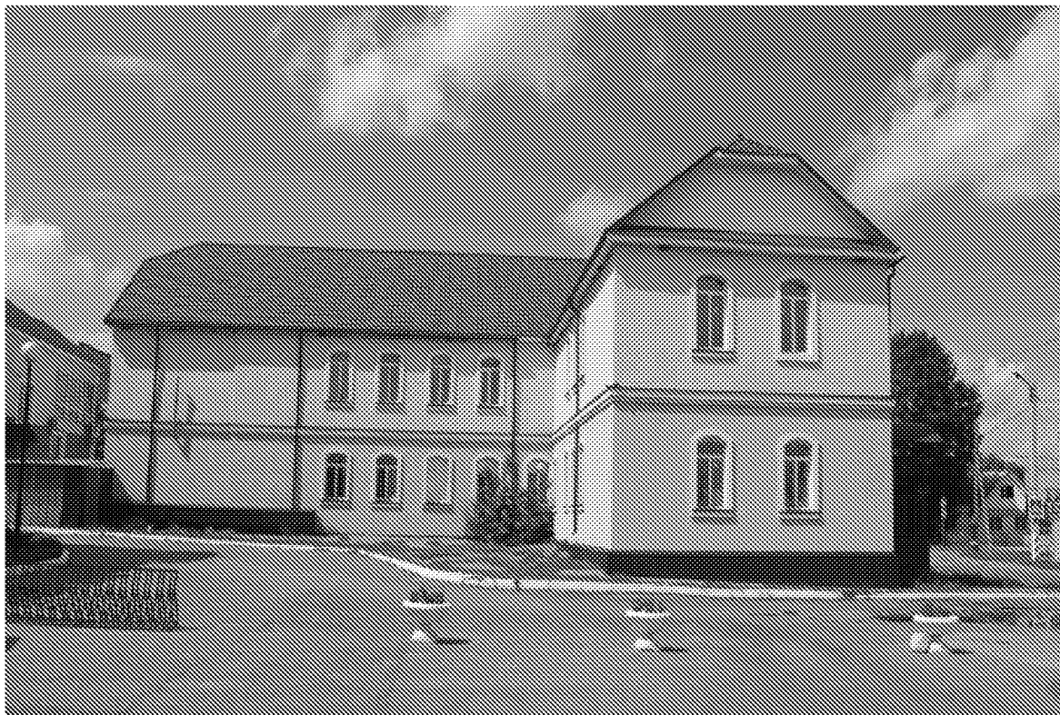
Восточный фасад объекта культурного наследия