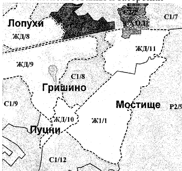
Утвержденные правила землепользования и застройки