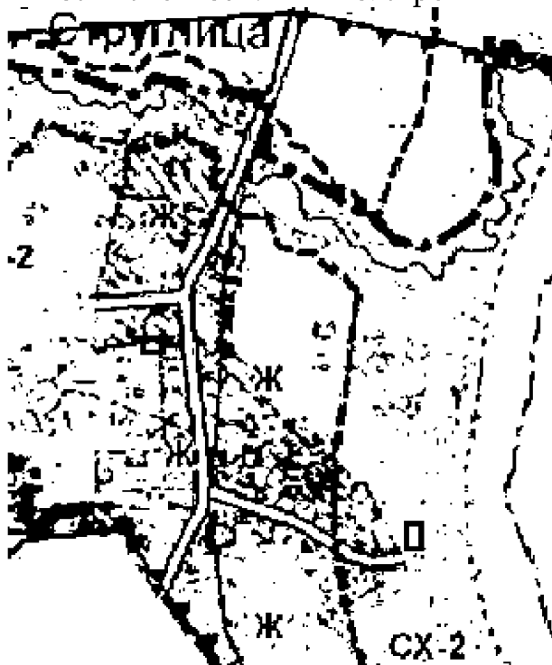
Утвержденные правила землепользования и застройки