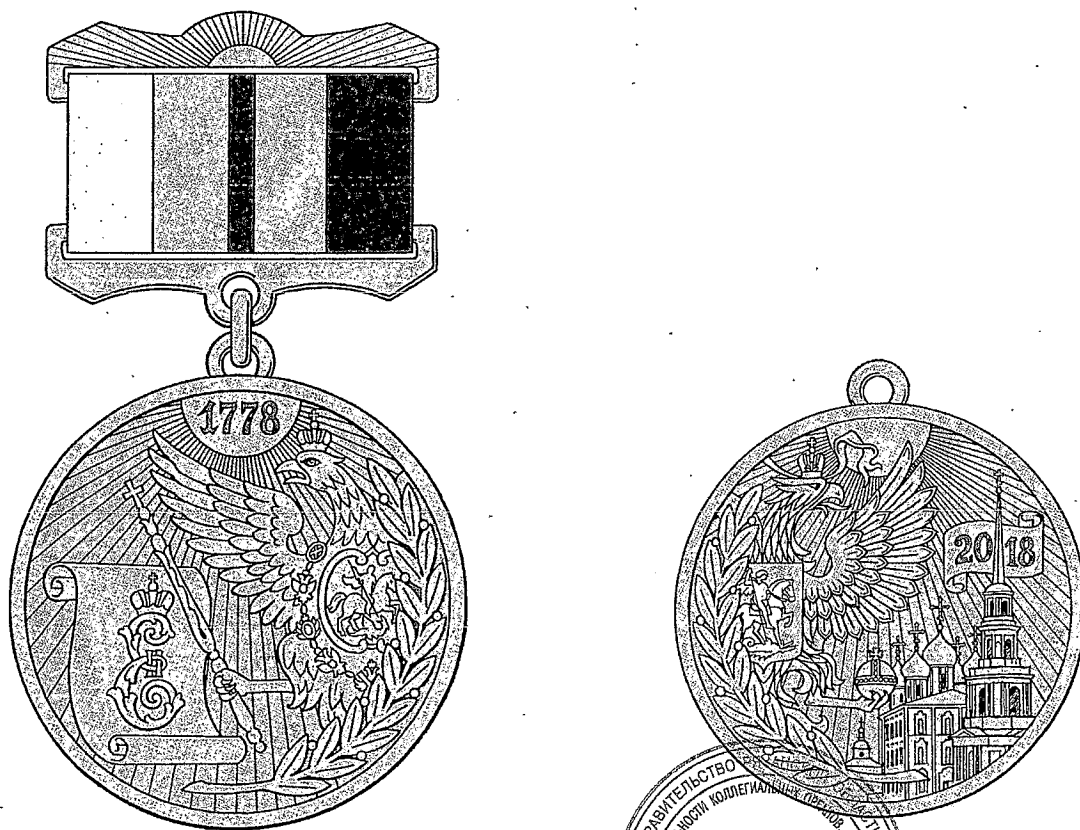
Рисунок знака Губернатора Рязанской области «240 лет Рязанской губернии»