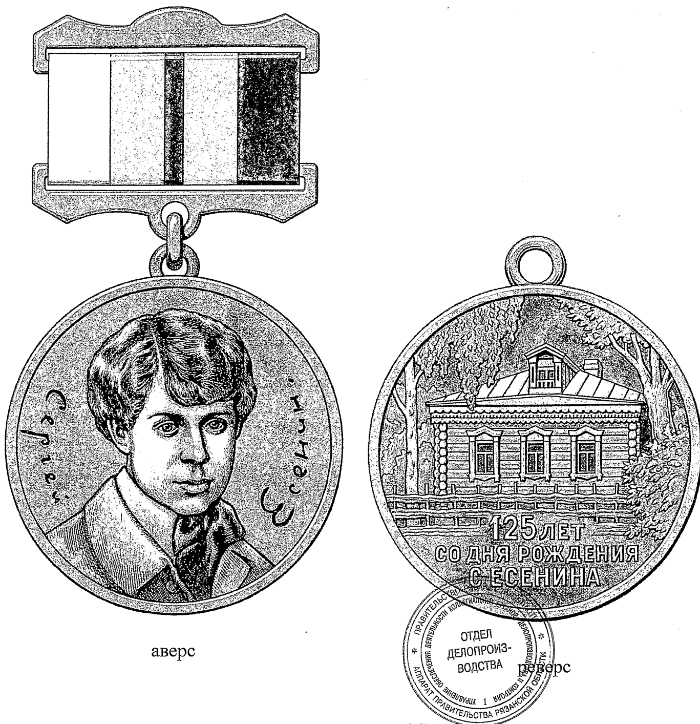
Рисунок знака Губернатора Рязанской области «125 лет со дня рождения Сергея Есенина»