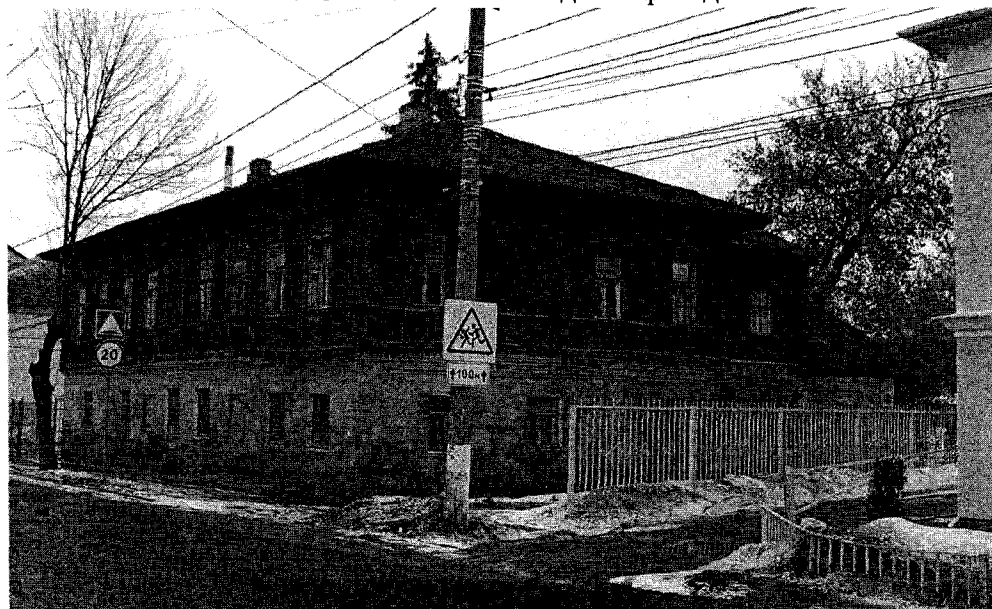
Фото 2. Вид с юго-запада.