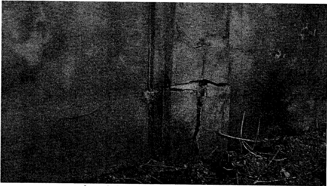
Фото 4. Фрагмент южного фасада лит. А.