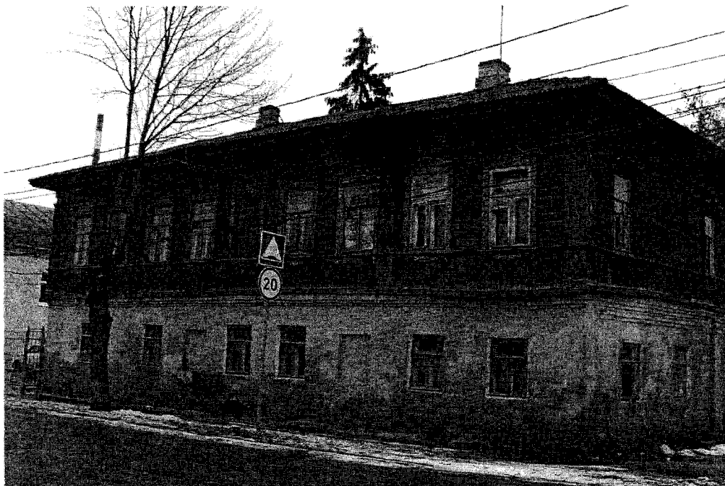
Фото 1. Главный западный фасад.

Фотографическое (иное графическое) изображение объекта культурного наследия (на момент утверждения охранного обязательства) объект культурного наследия регионального значения «Жилой дом Ф.Д.Костроминой», XVIII-XIX вв., Тульская область, город Тула, ул. Жуковского, 7, лит. А, А1