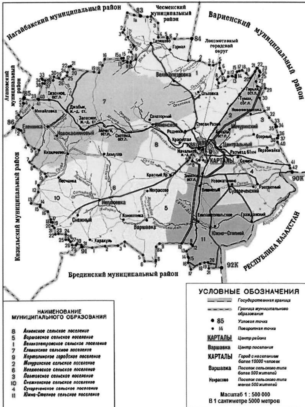
СХЕМА ГРАНИЦ Карталинского муниципального района

«Приложение 2 к Закону Челябинской области «О статусе и границах Карталинского муниципального района, городского и сельских поселений в его составе»