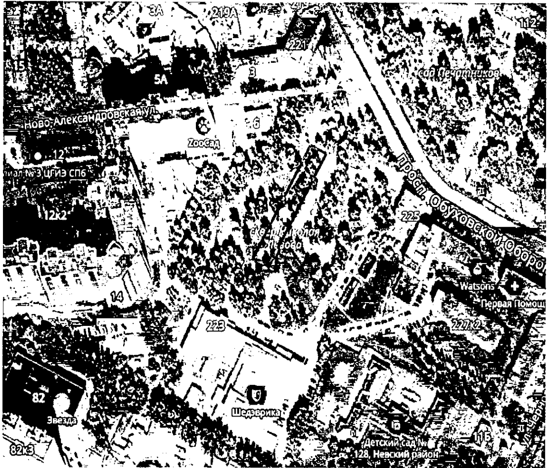
СХЕМА специально отведенного места в сквере Николая Львова

Приложение № 1 к постановлению Правительства Санкт-Петербурга от 16.04.2021 № 214