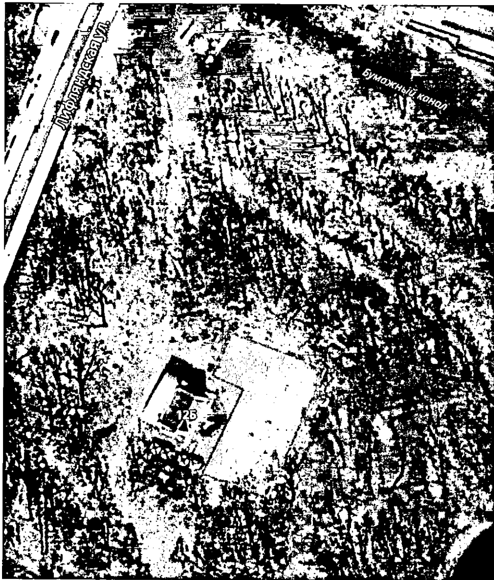
СХЕМА специально отведенного места в парке Екатерингоф

Приложение № 2 к постановлению Правительства Санкт-Петербурга от 16.04.2021 № 214