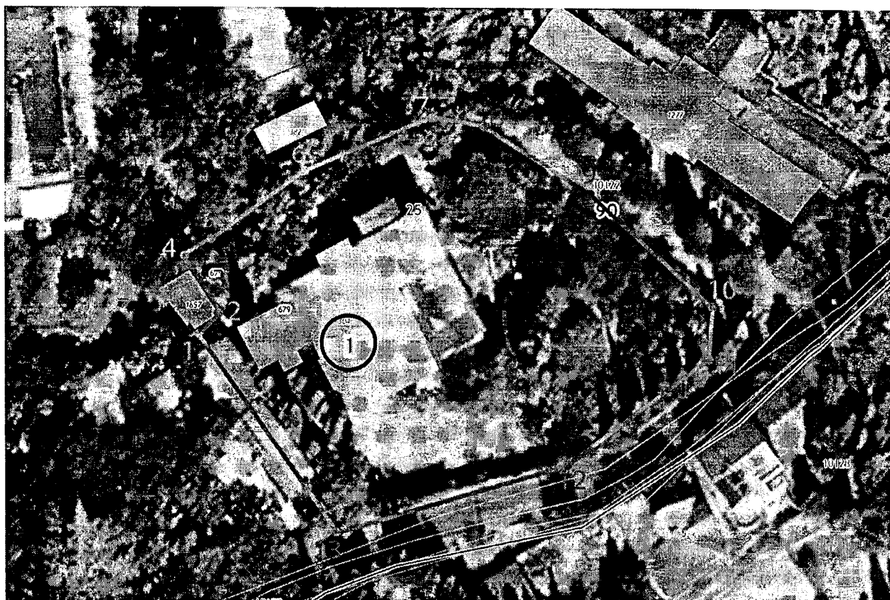
Схема границ территории