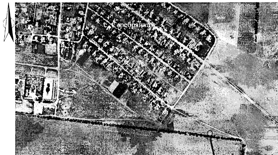
Схема границ территории